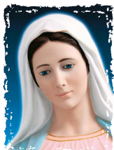
Collana: SAN GIUSEPPE