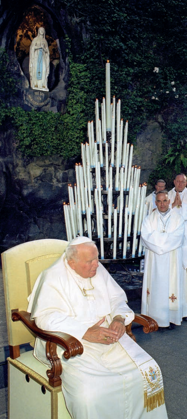
Giovanni Paolo II a Lourdes, il 14-15 agosto 2004, in occasione del 150° anniversario della promulgazione del dogma dell'Immacolata Concezione.